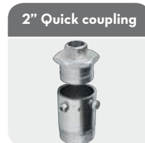
2" Quick coupling